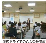
福岡ドライでのCA受験講座